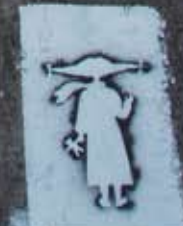
K.I., A.P., Fester