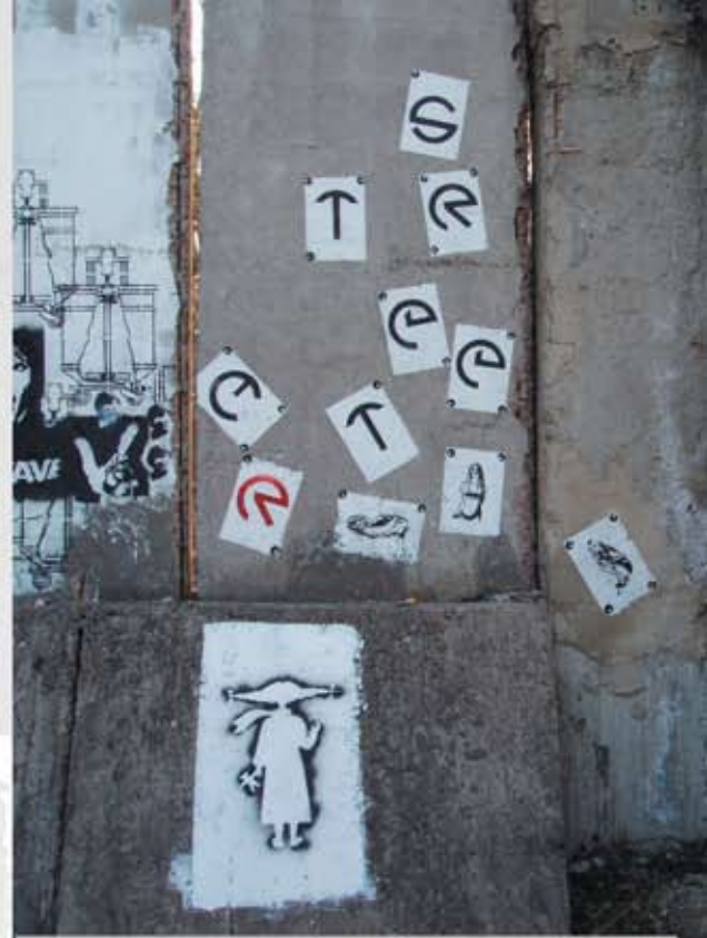
K.I., A.P., Fester