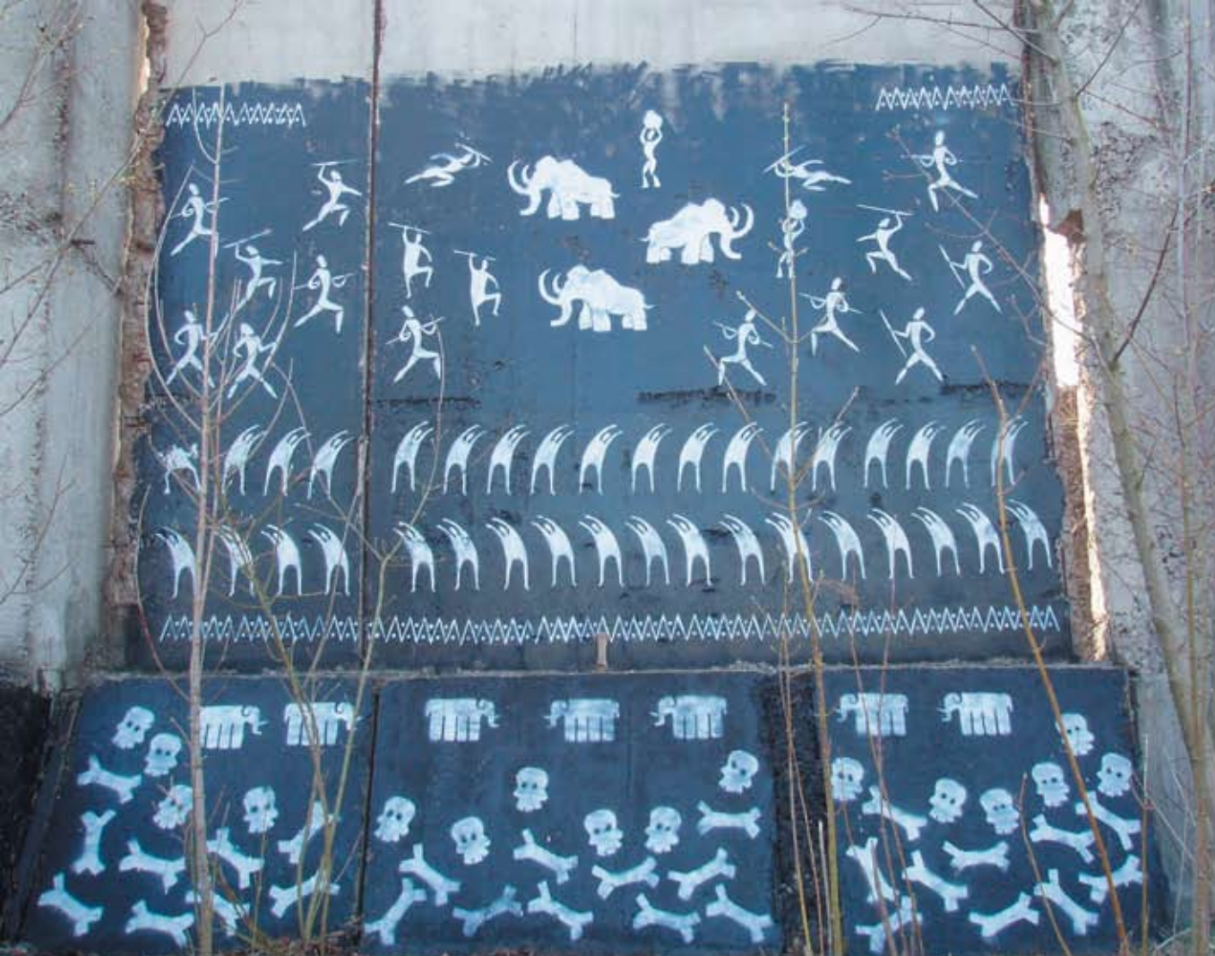
Vit, A60, Ircinss