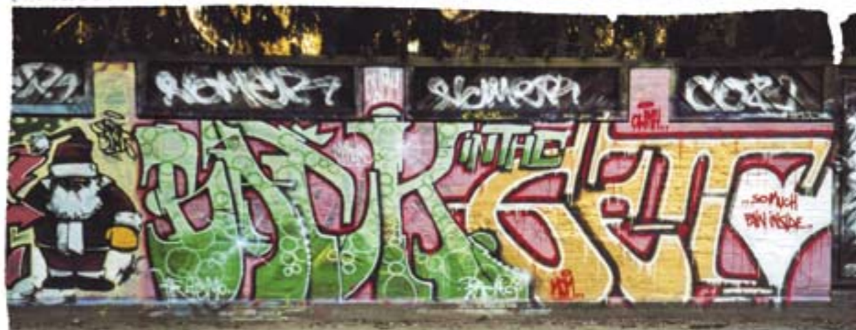
JONAS Character by KEATS Santa Claus BACK in the GHETTO