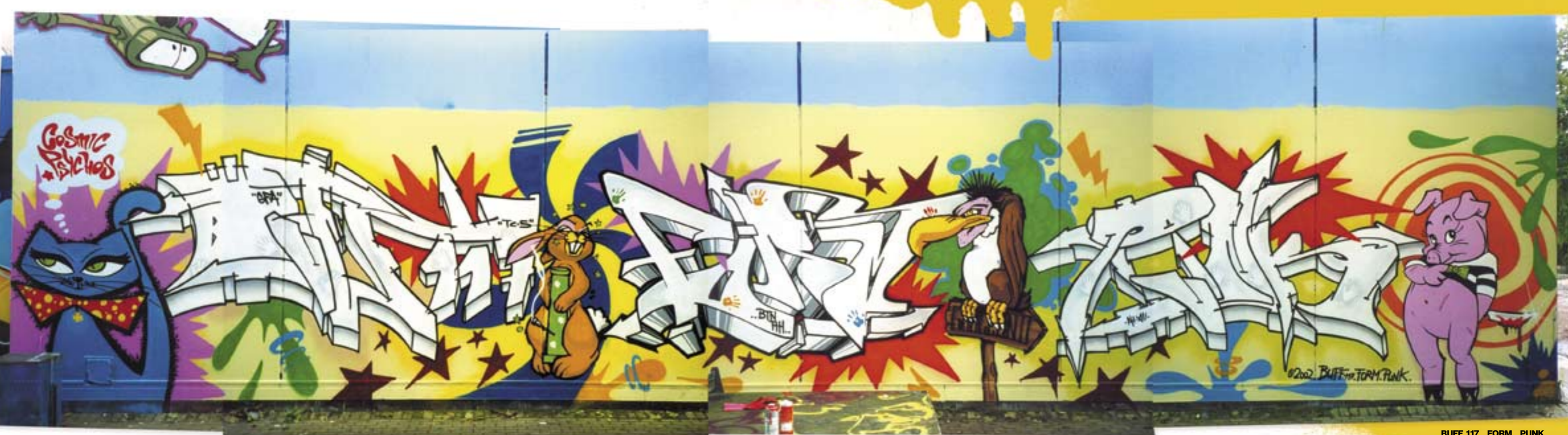
BUFF 117 FORM PUNK BUFF & PUNK by POET 62, Characters by PUNK